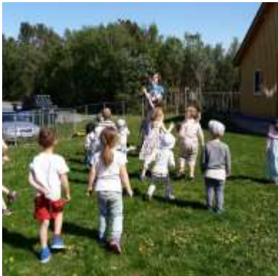
Såpebobler er gøy

Vi har delt barnehagen inn i soner i forhold til fordelingen av voksne i utetiden. Da sikrer vi at lek kan få en god utvikling, og vi kan selv delta aktivt i ulike lekegrupper.