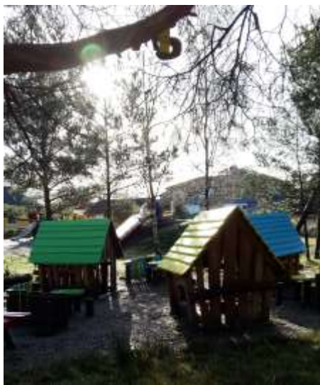
Vi fikk nye utelekeapparat vinteren 2016)

De voksne som jobber hos oss har stort sett vært de samme siden oppstart i nye barnehagen i 2004. Vi jobber mye med å gjøre barna trygg på alle voksne, og dørene er mye åpen mellom avdelingene på morgenen og om ettermiddagen. Vi er ofte sammen i ute-tiden, på samme ute-område.