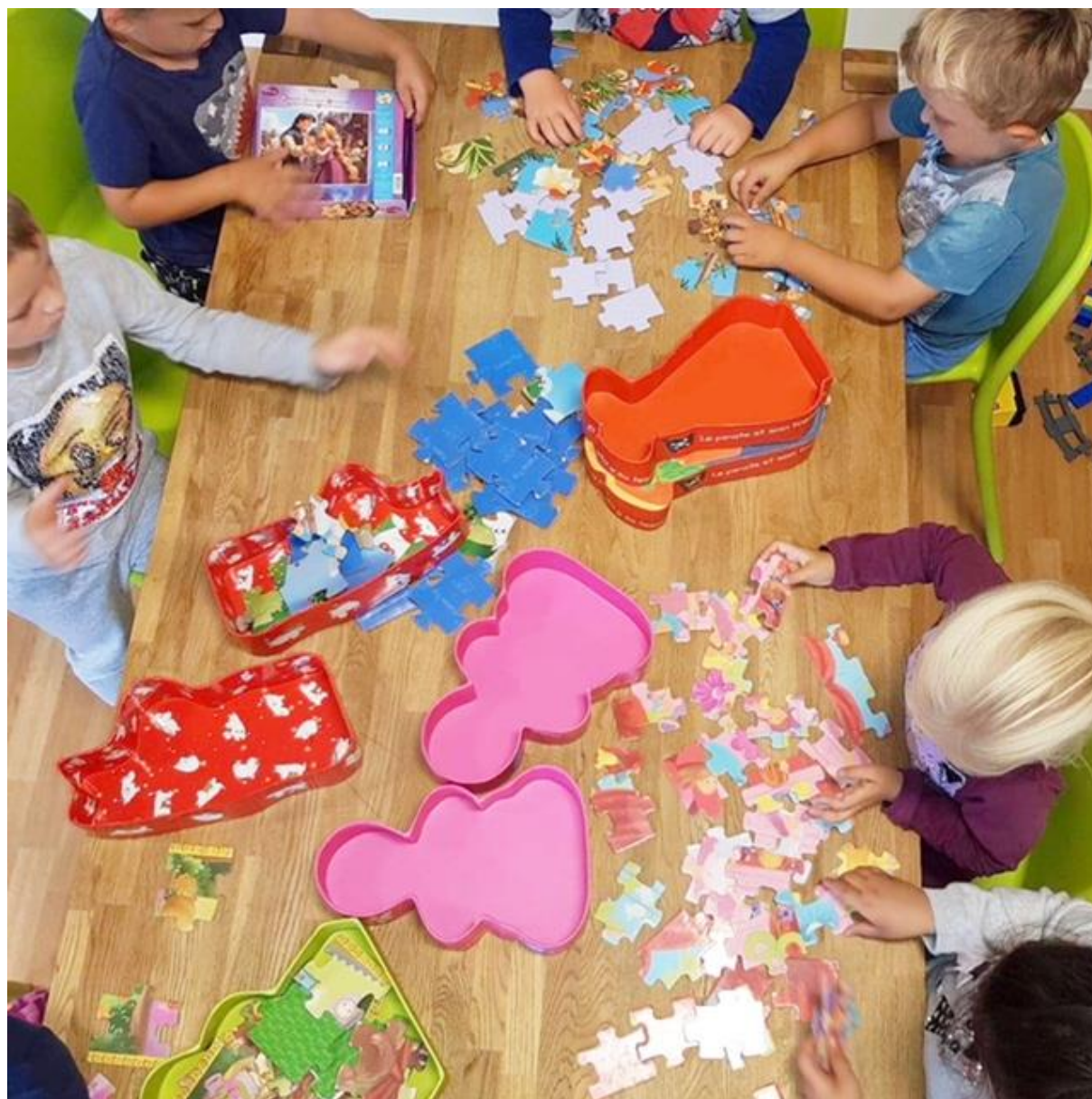
(Sett inn bildetekst her)